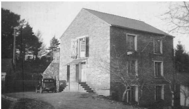
milin ar Bodri e 1939