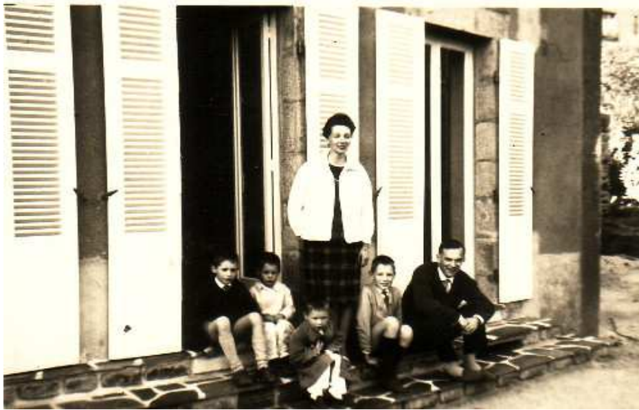
Ar familh dirak an ti e Gwaremm ar Groaz e St Mark (1963)