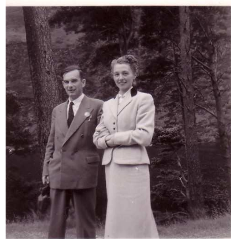
E Dulenn evit ar c'hendalc'h etrekeltiek (1950)