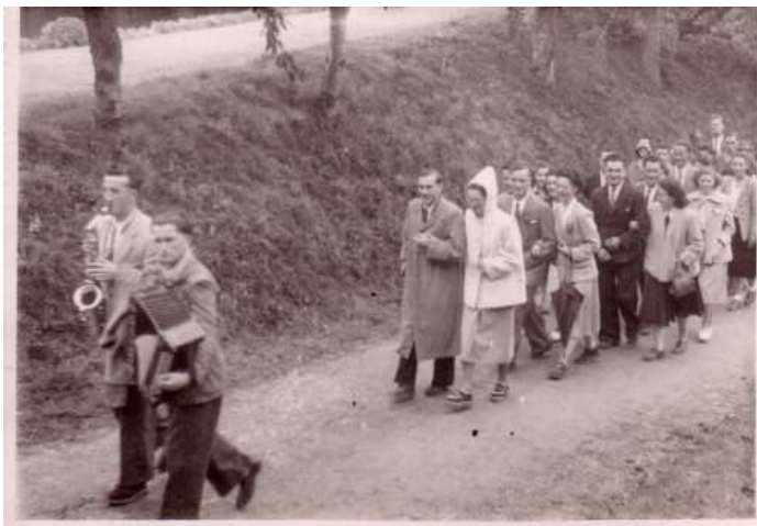
Deiz war-lerc'h o eured o vont war droad betek gar Baod